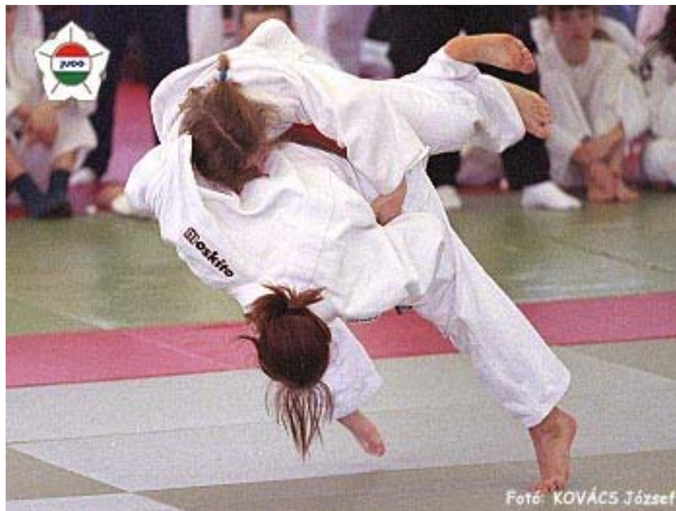
Jeanne d'Arc csoport

Büszkék vagyunk rá, hogy közénk tartozik és szurkolunk, hogy ott lehessen az olimpián.